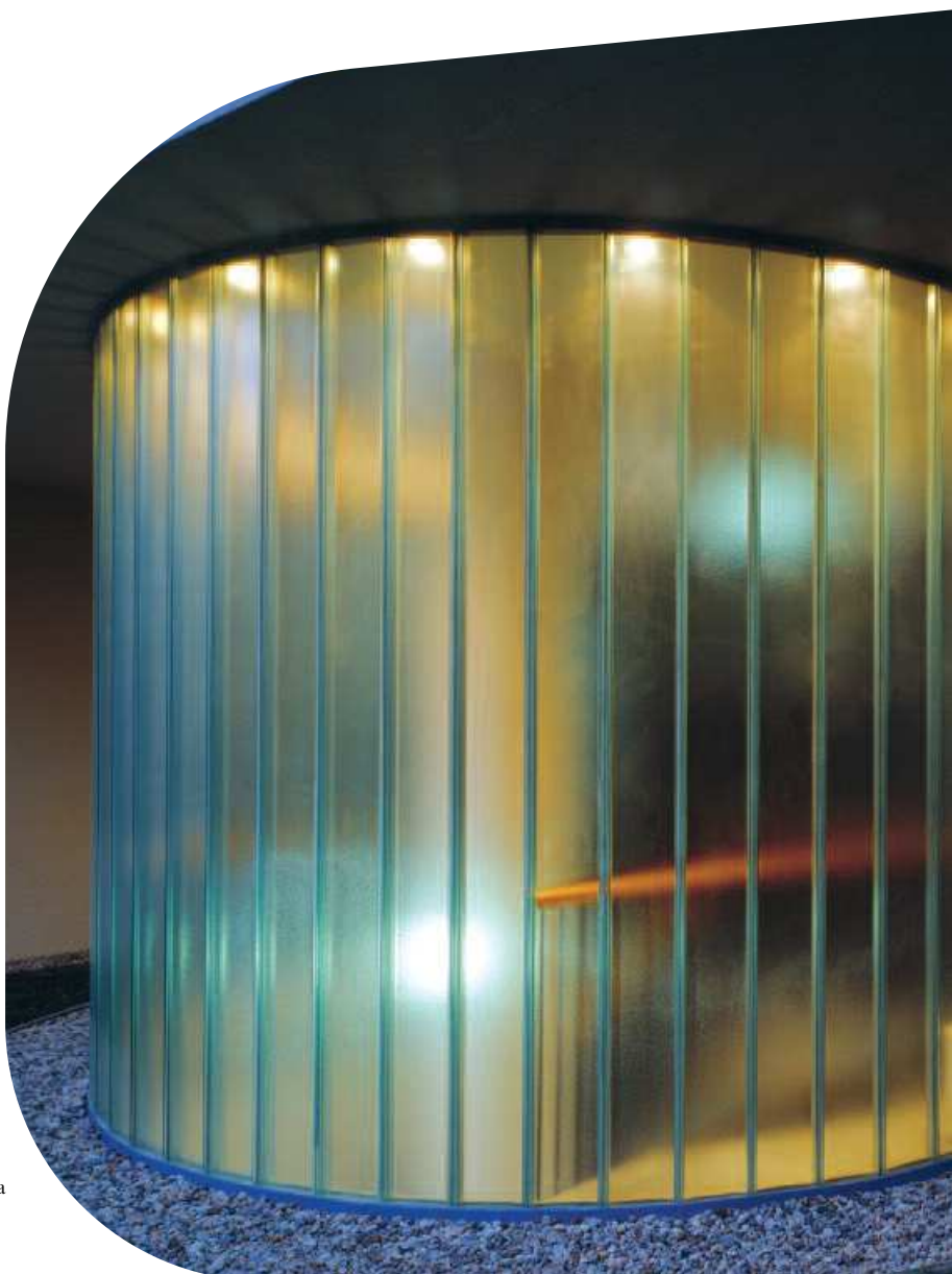
Mondrian House, Warszawa