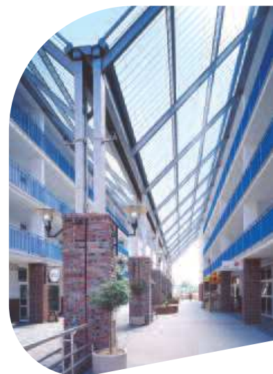
Pasaż handlowy, Tychy

Nie odbija się to negatywnie na wyglądzie, natomiast spełnia wymagania związane z bezpieczeństwem (zgodnie z normą DIN 18361).