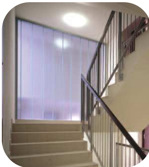
Osiedle Marina Mokotów, Warszawa

Zewnętrzne ramy aluminiowe dostępne są w wielu standardach wykończenia, na przykład anodowane lub z powłoką proszkową, według standardowej kolorystyki (RAL). Różnorodność dostępnej kolorystyki pozwala architektom i projektantom na użycie ich w celu uzupełnienia lub podkreślenia wyglądu elementów szklanych.