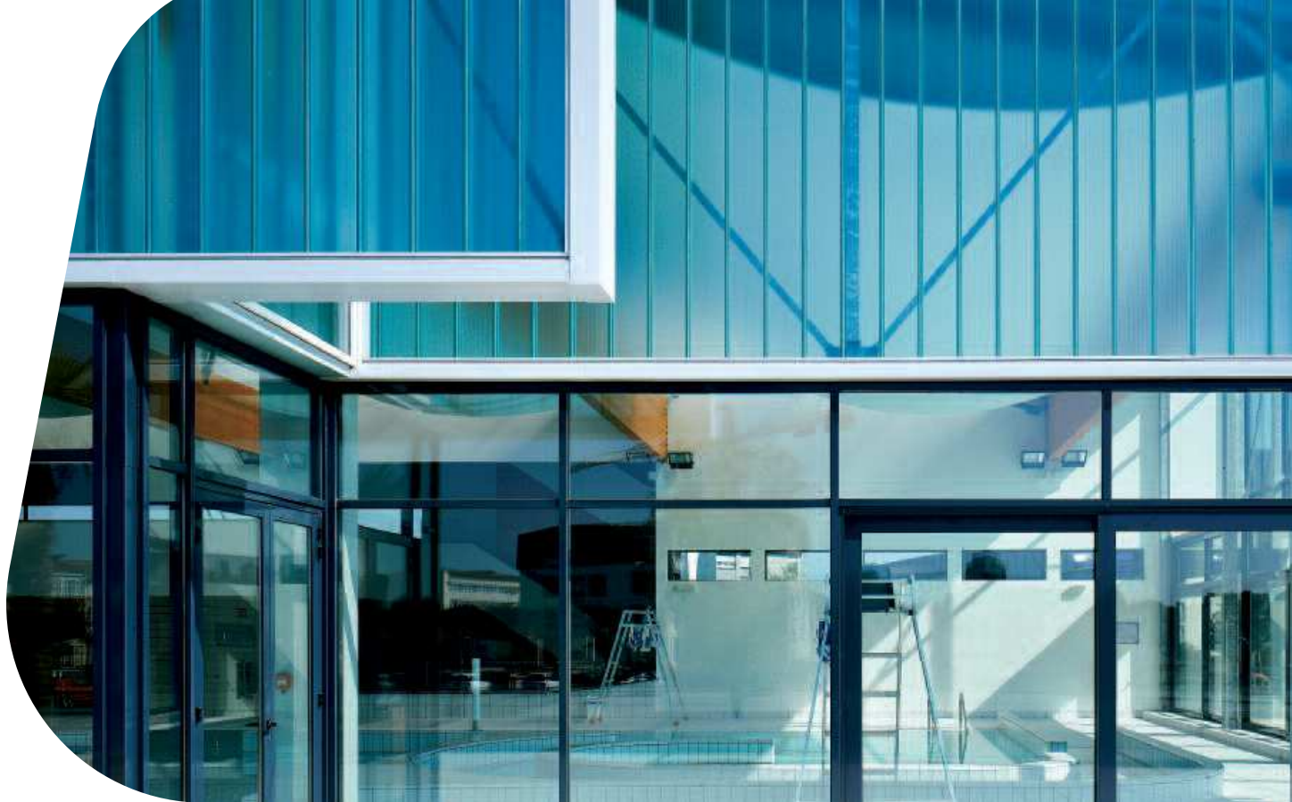
Basen, St Dizier, Francja